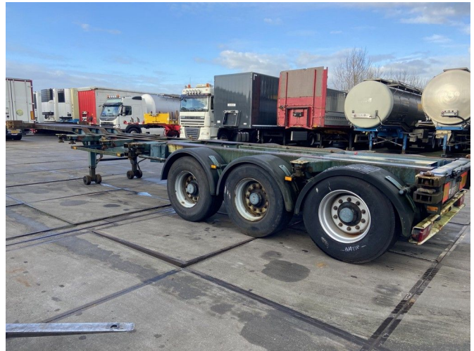
Renders RPCC 1227