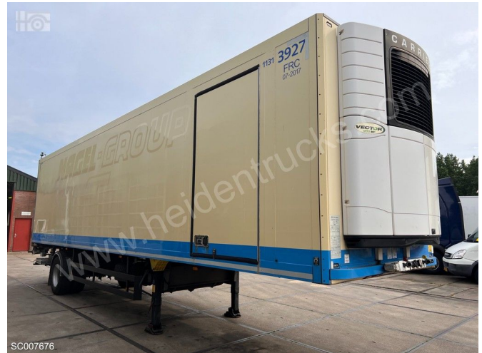
Schmitz Cargobull SKO10 | Carrier Vector 1850 MultiTemp | 2... Referentienummer: SC007676