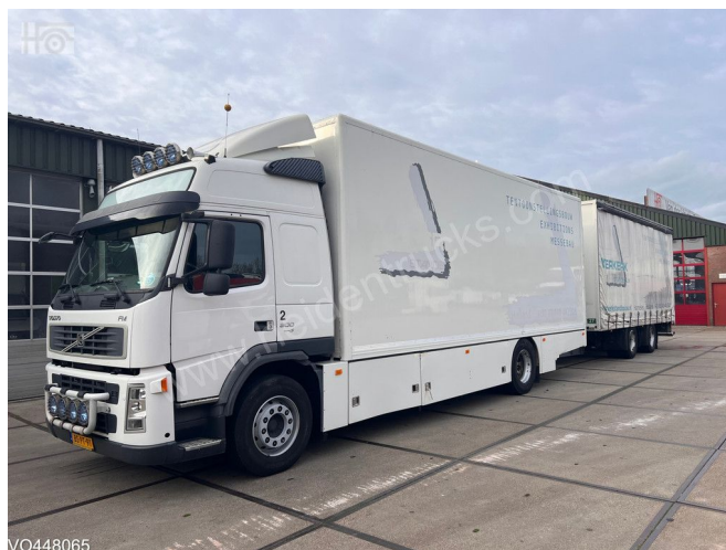
Volvo FM9 4x2 Euro 5 + Bulthuis | TUV